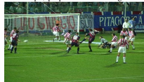
Il calcio lo sport più amato dagli italiani

Provate ad interrogare tutti quei credenti che quasi regolarmente si assentano dalla comune adunanza. Essi vi spiegheranno perché non hanno avuto la possibilità di partecipare all'offerta di un culto a Dio e se non lo avete ancora scoperto, scoprirete che non si sono recati in nessun luogo contaminato, ma sono stati semplicemente "troppo occupati" per ricordarsi delle realtà spirituali. Ormai è norma che i cristiani accettino ed organizzino i loro lavori senza preoccuparsi di subordinarli alla vita ed alle esigenze dello Spirito, come è anche norma che essi facciano i loro programmi familiari, dispongano del loro tempo, preparino i loro svaghi o le