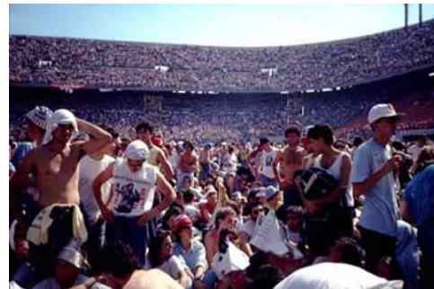
Immagine da un concerto

te nel loro approccio con certe dottrine. Il caso più noto è quello di un giovane di La Spezia che nel 1996 fu protagonista di visite notturne nei cimiteri, con profanazioni di tombe e furti di teschi ed ossa. Il ragazzo, oggi completamente pentito, ha dichiarato: "mi sono lasciato trascinare dalla musica black metal che seguo da più di 10 anni. In particolare i testi di alcuni gruppi norvegesi e svedesi tra cui i Mayhem, i Darkthrone e i Marduk. Mi hanno condizionato a tal punto che ripetevo come un automa quello che loro raccontavano nelle canzoni. Quella musica che ascoltavo anche 10 ore al giorno, mi prendeva a tal punto che non mi rendevo conto della gravità dei miei gesti." All'epoca la procura di La Spezia condusse una vasta indagine che coinvolse altri nove giovani, accusati di danneggiamento e violazione di sepolcri e di furto aggravato d'arredi sacri. Il filo conduttore che li legava era proprio l'interesse per la musica satanica. Il satanismo attraverso la musica rock ha condizionato anche le discoteche. La grande esplosione di questo fenomeno musicale si verifica nel 1977 con il film "la febbre del sabato sera", nasce la cosiddetta disco-music ribattezzata dance-music. Per i discografici è la grande occasione di fare soldi con pochi sforzi. Il trionfo del nulla, è proprio questa l'essenza satanica della musica da discoteca. Non a caso, oggi, la disco-music si chiama "thecno", un nome