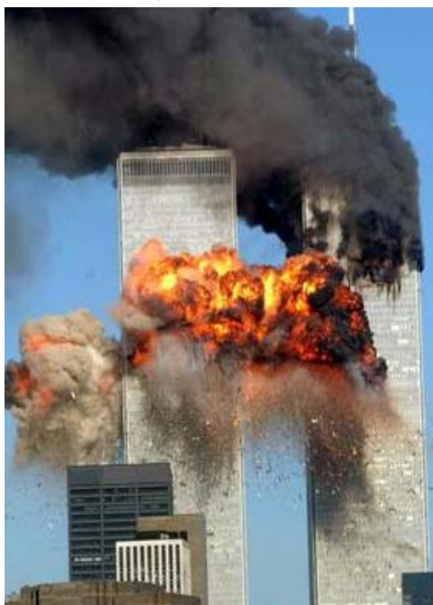
World Trade Center

non rubare e di amare il prossimo come noi stessi. Ed abbiamo detto OK. Poi, Dr. Benjamin Spock ha detto che non dovremmo dare botte ai nostri figli quando si comportano male perché questo porta danno alle loro piccole personalità e potremmo danneggiare la loro autostima (il figlio di Dr. Spock si è suicidato).