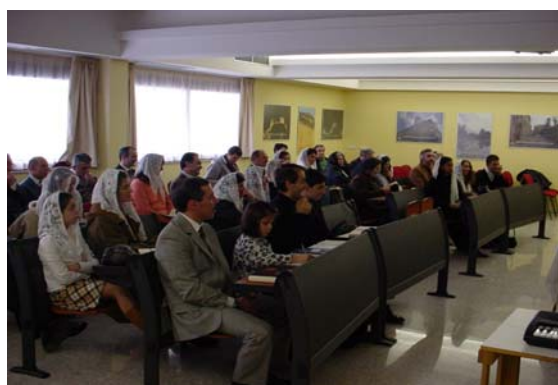
Una panoramica della sala gentilmente concessa per l'occasione dal Comune di Macerata Feltria

La giornata è terminata con l'amore fraterno vincitore, l'animo di tutti consapevole della maestà di Dio e la voglia di ritrovarsi per queste occasioni al più presto, certi che in ogni caso un giorno "tutti ci ritroveremo nel cielo", così come dicono le parole del canto che hanno chiuso il culto.