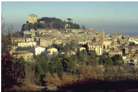
Una veduta di Chianciano Terme

Ci sono due fermate intermedie nel nostro viaggio di avvicinamento: Cesena Nord e Mercato Saraceno. Altri tre compagni di viaggio si uniscono a noi. Quando siamo finalmente al completo, il pastore con il suo potente mezzo ci saluta per precederci e per sbrigare le pratiche cosiddette "dell'accettazione", termine comprensibile forse solo per pochi. In realtà ha un significato molto semplice: evitare di fare la fila per pagare il saldo dell'iscrizione al convegno! Se poi questo vi sembra poco bisogna sottolineare che occorre ritirare il cartellino di riconoscimento senza il quale nessuno entrerà nella tenda di convegno e il raccoglitore con gli studi biblici e alcuni opuscoli informativi preparati dai responsabili del banco libri. Il viaggio è un'occasione fondamentale per conoscere meglio non solo i fratelli e le sorelle di Rimini e dintorni ma anche l'E 45, una strada che è una continua sorpresa: dossi e cunette non segnalate, mancanza di corsie d'emergenza, deviazioni e restringimenti di carreggiata che hanno l'unico scopo di ammirare posti e paesi dove probabilmente non sarei mai capita-