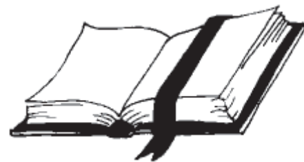
La tua parola è una lampada ...

b. Non ascoltava i consigli. (Giud 14:3). Egli manifesta quella che è una caratteristica negativa della giovinezza "la presunzione". I giovani, man mano che crescono e fanno esperienze credono di sapere già tutto, se poi ci mettiamo l'orgoglio umano