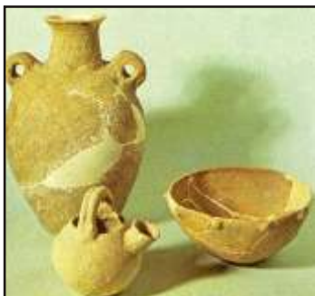
Va' fuori, chiedi in prestito a tutti i tuoi vicini dei vasi vuoti

"Non basta avere il bastone del Profeta se non si ha la potenza del profeta"