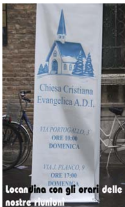
Locandina con gli orari delle nostre riunioni