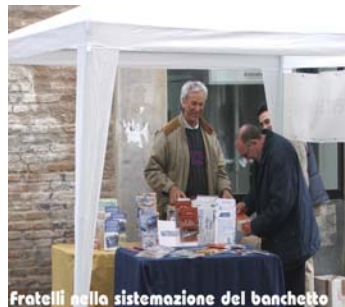
Fratelli nella sistemazione del banchetto

a b b i a m o svolto questo servizio con allegrezza e con la guida e la