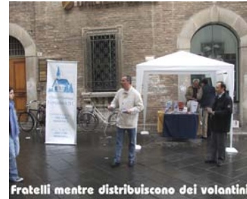
Fratelli mentre distribuiscono dei volantini

Nella giornata di sabato 2 aprile, ci siamo spostati in piazza Cavour, dove anche qui