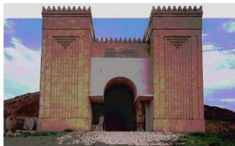
Ricostruzione della Porta di Ninive capitale dell'Assiria